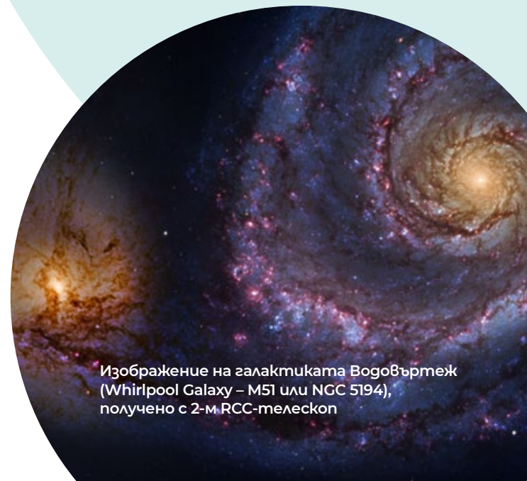
Изображение на галактиката Водовъртеж (Whirlpool Galaxy – M51 или NGC 5194), получено с 2-м RCC-телескоп

С новите инструменти се очаква НАО Рожен да разшири още повече обхвата на своята професионална дейност в сферата на астрономията.