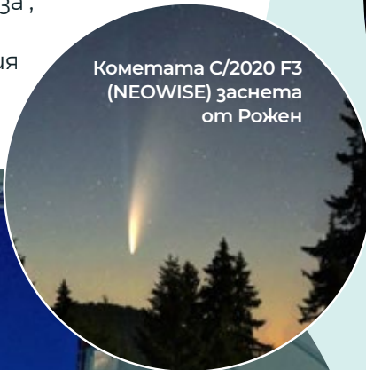
Кометата C/2020 F3 (NEOWISE) заснета от Рожен

В НАО се осъществяват астрономически наблюдения на световно научно ниво. Изследват се: природата на квазарите (най-отдалечените наблюдаеми обекти във Вселената); структурата и звездообразването в близки галактики; свръхнови; звездни купове в Млечния път; специфич-